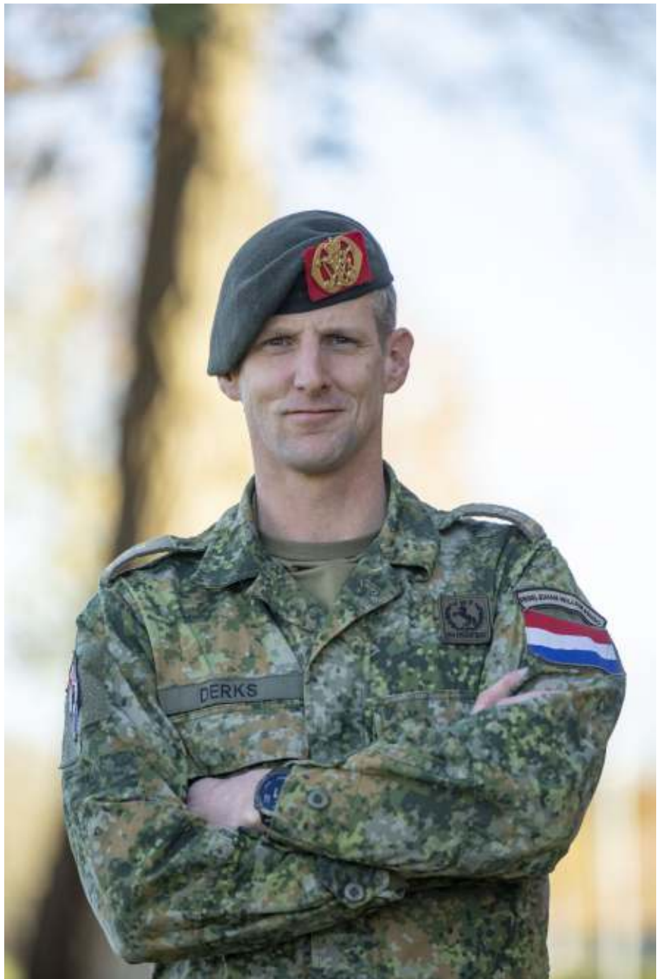
Lt. kol Erik Derks: "Samen dienen, scheidt een band voor het leven..."

Ook bij de huidige militairen hoop ik te bereiken dat ze trots op het 44e zijn. Bij mijzelf heeft het blauwe koord een speciaal plekje in mijn hart. Wat dat betreft voelde het aanvaarden van het commando over 44 Pantserinfanteriebataljon als thuishomen. Ik ben er mijn militaire carrière nota bene gestart en heb nooit in een ander bataljon gediend."