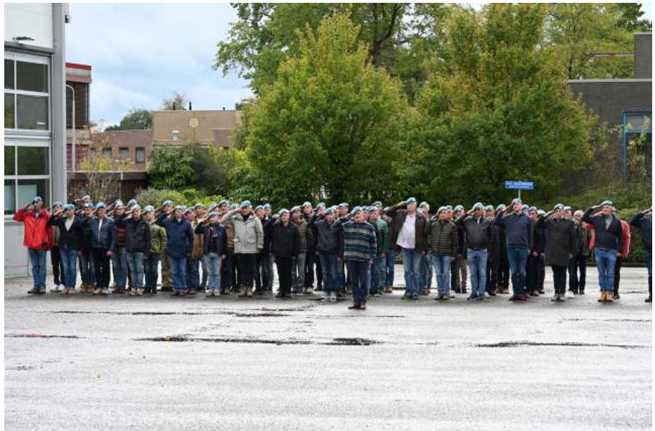
Het opstellen ging best wel goed